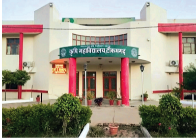
पर भी ध्यान देने को कहा गया है।

जिले में आगामी दिनों में बढ़ती गर्मी को देखते हुए कृषि विशेषज्ञों ने किसानों के लिए महत्वपूर्ण सलाह एडवाइजरी जारी की है। किसानों से अपील की गई है कि वे खाली खेतों में मिट्टी पलटने वाले हल से गहरी जुताई करें तथा फसल अवशेष नरवाई को जलाने से बचें, ताकि मिट्टी की उर्वरता बनी रहे और पर्यावरण को नुकसान न पहुंचे। आगामी पांच दिनों तक मौसम शुष्क रहने और आसमान साफ रहने की संभावना है। बताया गया है कि अधिकतम तापमान 35 से 37 डिग्री सेल्सियस और न्यूनतम तापमान 17 से 19 डिग्री सेल्सियस रहेगा साथ ही हवा की गति 2 से 7 किमी प्रति घंटा रहेगी। ऐसे मौसम में किसानों को फसलों की सिंचाई सुबह जल्दी या शाम के समय करने की सलाह दी गई है, साथ ही निराई-गुड़ाई